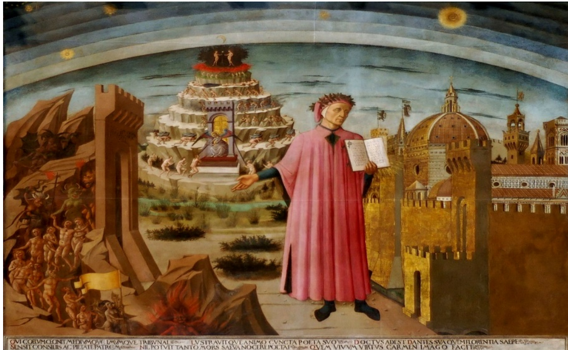
Dante con in mano la Divina Commedia, da sinistra la porta dell'Inferno, il Purgatorio, le sfere del Paradiso e a destra la città di Firenze