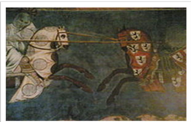
Particolare di un affresco, Palazzo Comunale di San Gimignano 1292 (Forse Dante ha combattuto così)?

I Guelfi e i Ghibellini erano due fazioni in lotta per il potere. I ghibellini sostenevano l'imperatore mentre i Guelfi appoggiavano il Papato. I Guelfi fiorentini erano divisi in due fazioni: Bianchi e Neri. I Bianchi con a capo la famiglia dei Cerchi, cercavano di conservare l'indipendenza di Firenze minacciata dal Papa, Bonifacio VIII. I Neri, guidati dalla famiglia dei Donati, rappresentavano gli interessi della nuova borghesia mercantile ed erano disposti ad allearsi con il Papa. La famiglia di Dante era Guelfa e Dante era di parte Bianca.